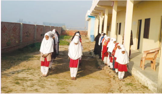
شناخوانی و مدرسہ کا ترانہ پیش کرتی ہوئیں طالبات