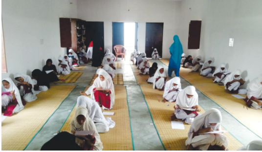
دوران امتحان سوال حل کرتی ہوئیں طالبات